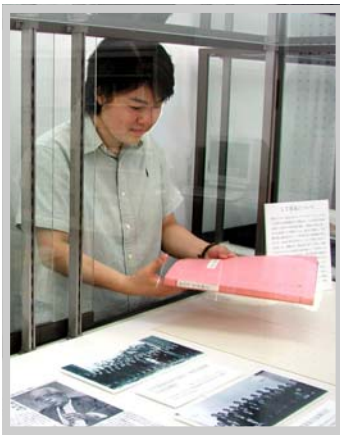
てんじ ようす -展示をしている様子-