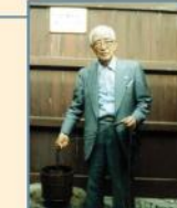
淮安・周恩来総理生家にて 昭和58年8月(1983)