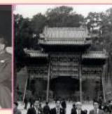
北京・北海公園にて 昭和53年10月(1978)