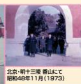
北京・明十三陵 曹山にて 昭和48年11月(1973)