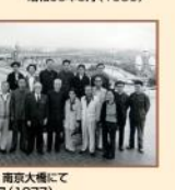
南京・中山陵 南大門にて 昭和52年6月(1977)