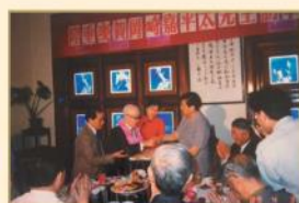
重慶・99回目の訪中で歓迎を受ける 平成元年4月(1989)