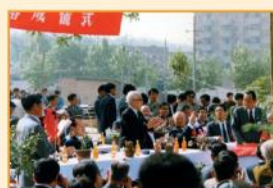
吉備真備記念碑除幕式にて 昭和61年5月(1986)