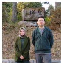
大和山山頂「望郷の 碑」前にて 碑の清掃も行って下さ いました