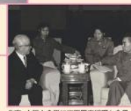
北京・人民大会堂にて周恩来総理と会見 昭和46年3月(1971)