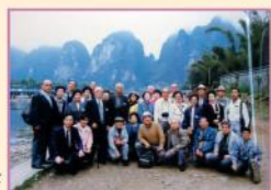
元池田鉄工の社員連と桂林にて 昭和63年3月(1988)