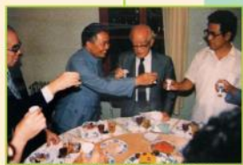
貴州省 省長 王朝文氏等と 昭和60年7月(1985)