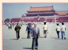
北京・天安門広場で 昭和60年7月(1985)