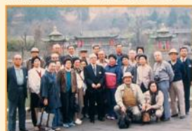
元池田鉄工の社員連と西安・華清池にて 昭和63年4月(1988)