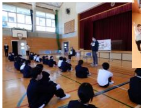
大和小学校にて ジャンケン大会や玉入れをして 交流しました